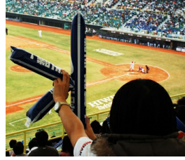
充氣加油棒雖然方便，但卻製造垃圾問題。

更希望這些優秀的球員能留在台灣，為台灣的棒球生態添加更豐富的色彩，當然，這些改變無法一蹴可及，需要政府、企業和群眾的支持，不過台灣人的熱血，總是能夠令人動容。