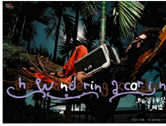
▲2005年入圍葛萊美獎的唱片：王雁盟的《飄浮手風琴》。

至情至性的蕭青陽，書中更是提及自己過去和大家一樣曾有段漫無目標的時光，他當過雜誌美編、在小吃攤賣過麵，最後幸運地找到這個值得投注一生心力和熱情的唱片設計工作：「我坐在輪椅上熬過了長達三個月的不便生活。.....在這段時間裡，我不停想到，我真的已經年老到不怕地不怕老到當整個人被推進手術房時腦海裡想到的全是我正要進行的作品與納手術場景的可能連結.....我更加篤定確信，這輩子再不可能離開從事唱片設計的生活了」。讀到這裡，令人不禁嘆為觀止，對於時下庸庸碌碌的人們而言，不跳槽換跑道已經很不可思議，更何況是一個與工作愛情長跑十八年，卻絲毫不減熱情甚至歷久彌堅的故事？