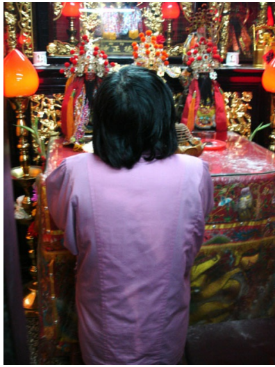
▲土地公地祭桌前，信徒虔誠地跪拜祈求。最初土地公僅是掌管稅務的神，到後來，竟然連人們家中的大小事，都成了祂的管轄範圍。