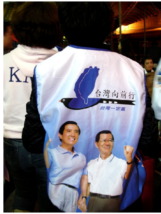
▲台上熱鬧的造勢活動，台下也不遑多讓，支持的民眾甚至穿上印有候選人的背心，「台灣向前行」的人體宣傳也相當引人注目。