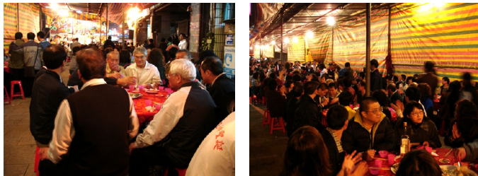
▲為了慶祝店仔街福德宮建廟三百餘年，廟方不僅舉辦遶境祈福的活動，更在晚上席開一百五十桌，由每戶民眾認養參與慶祝，現場不只筵席豐盛，還有藝人主持歌舞秀炒熱氣氛。