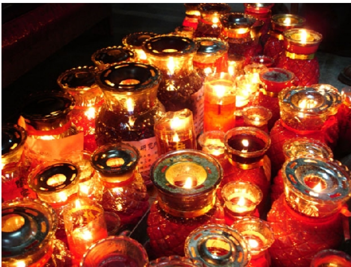
▲每一盞光明燈，都代表著一個希望，有人祈禱研究所順利考上，有人祈禱全家平安健康。廟前的香爐下，土地公守護著每一個人對未來光明的期待。