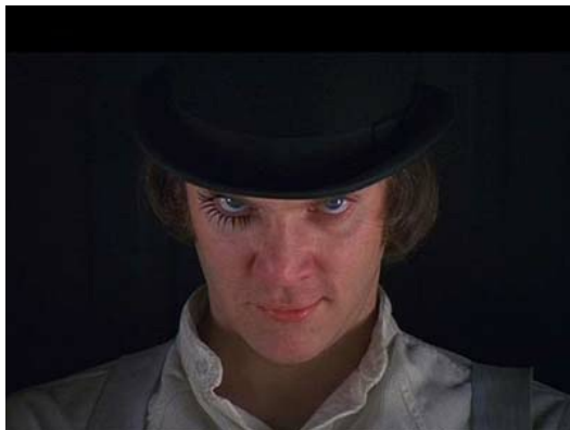
▲電影開頭特寫Alex的笑容（截圖自影片）

善、惡為人性的兩種特質，社會體制教育人們要隱惡揚善，因為「惡」會帶來社會的不安和混亂，「善」則使社會光明溫暖。這是為一般大眾所接受也習以為常的觀念，但你如果看過史丹利·庫伯力克（Stanley Kubrick）執導的「發條橘子」（Clockwork Orange），一定會被導演對「惡」的觀點感到震驚。這部1971年代拍攝的老電影，在當年上映時被英國、台灣等地列為禁片，內容赤裸地描繪暴力與性愛，大膽呈現人性最邪惡的一面。令人意外的是，此片在當時竟入圍了美國奧斯卡最佳導演與編劇，深受美國人喜愛，並被列為「X」級的影片上映。