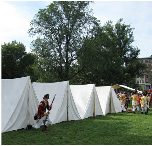
體驗紮營活動和賣傳統物品的店鋪。