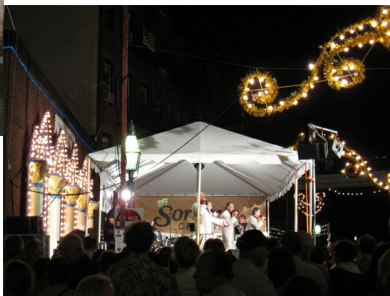
連續四天的義大利慶典 Fisherman's Feast ，每天都有不同的慶祝活動，猶如台灣的夜市，有著射氣球和打靶遊戲，以及各種音樂表演，右下為Joey Dee and The Starliters的演出，各式各樣的攤販熱鬧了整個夜晚。