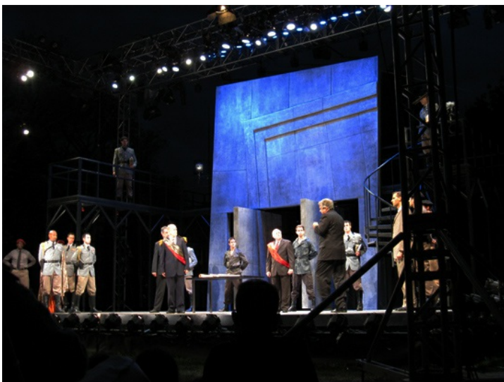
每年夏天，波士頓公園(Boston Common)的年度盛事之一就是由Commonwealth Shakespeare Company 演出的露天莎士比亞劇，今年2010年演出莎士比亞四大