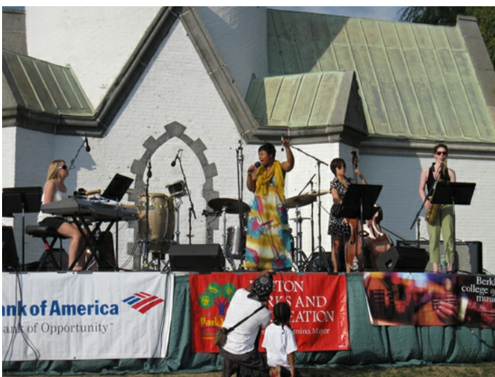
Berklee College of Music的學生們演奏爵士樂，活潑中不失專業。