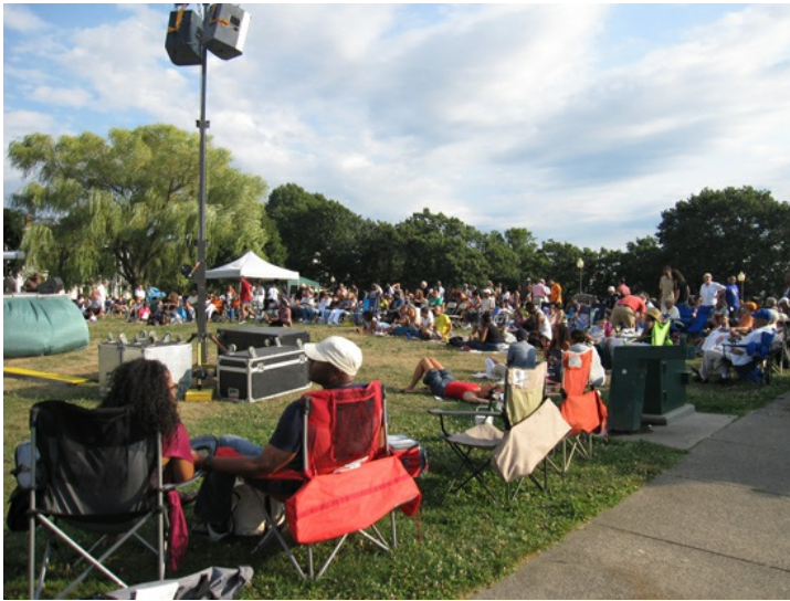
幾乎人人自備攜帶方便的沙灘椅、鋪毯和點心，邊聽音樂邊野餐，享受自然輕鬆的氣氛。