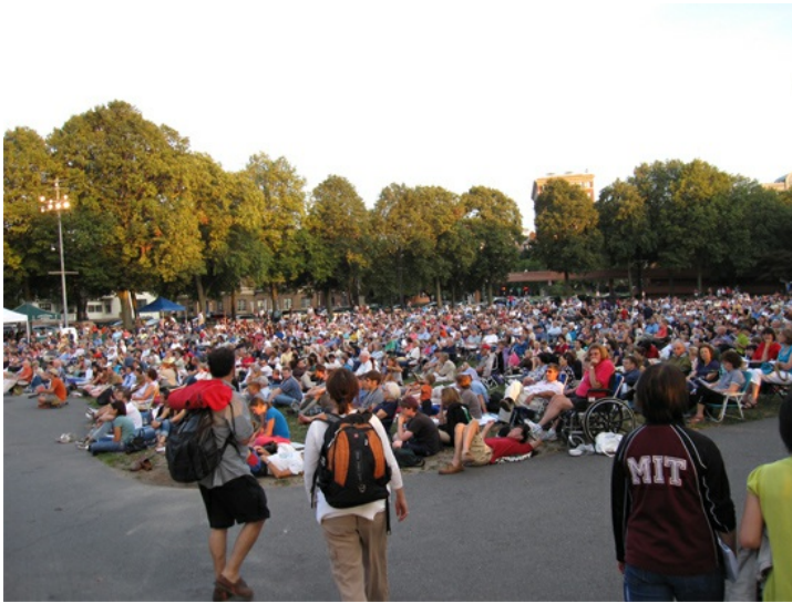
人山人海的觀眾占滿整片草皮，不用到國家音樂廳，在河岸就可以免費享受優質表演，因此被稱為 "A gift of music for the city"。