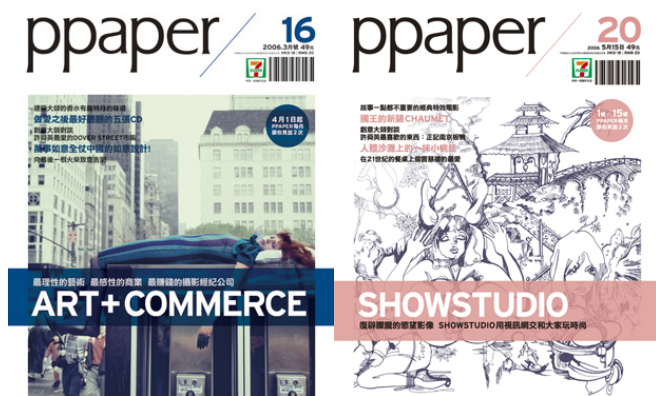
▲最暢銷的兩期ppaper雜誌

驗，在印刷上使用異於其他台灣雜誌的膜造紙，他認為一般雜誌所使用的銅板紙並不好，無法達到他所要求的視覺效果。如此一來，讀者對《ppaper》的期望會比較少，相對也比較容易做出超越別人期望的東西。