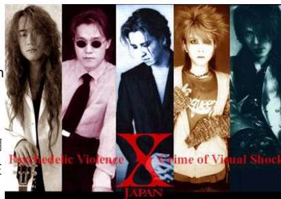
▲X-JAPAN的成員，右至左為PATA、TOSHI、YOSHIKI、HIDE、HEATH。

從《Blue Blood》開始，日本括起了一陣X旋風，X也趁勢陸續發表了許多單曲，以及巡迴演唱，同時也得到不少日本音樂界的獎項肯定，例如全日本有線大賞最優秀新人獎、日本Gold Disk大賞「New Artist of the Year」。到了1991年，發行了第三張錄音室專輯《Jealousy》。