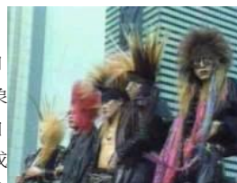
▲X-JAPAN早期較為誇張的視覺系扮相。