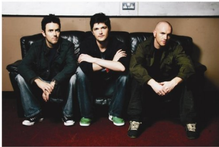
(由左到右：鼓手Glen Power、主唱Danny O'Donoghue、吉他手Mark Sheehan)

九月風起，夜涼了許多，卻讓人再也睡不著---睡不著的理由 應該很多，卻沒一個真能夠解釋為什麼睡不著。於是我坐起身，知道自己失眠了。失眠時能做很多事情，而這些事情彷彿只能夠在此刻完成，就在這段向夢境借來的時間裡，這最寧靜，最接近靜止的時間裡，我清醒著發現自己該寫點什麼，卻發現我必須寫The Script---一個上床前聆聽的樂團，如今仍在腦裡哼唱---也許，就是他們殺死了我的睡眠。可惡的，精采的，The Script (手創樂團)。