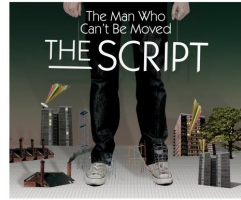
(“We Cry” 單曲封面) (“The Man Who Can't Be Moved” 單曲封面)

第二支單曲 “The Man Who Can't Be Moved” 則是在7月發行，更是一口氣登上了愛爾蘭單曲榜、英國單曲榜前三名！