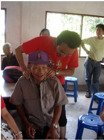
榮民之家的老先生。

最後我們去到愛滋病防治中心，清幽的環境讓人聯想到的是渡假村而不是隔離病患的地方，參觀了幾個博物館後，我們亦到了後面的病院參觀。但一團四十多個人只是進去再出來，與病人間並沒有交流，我們只能向病人微笑，接著就走了，這樣讓我自己覺得好像是打擾他們的休息。其實我們可以為他們再做多一點的，而不是像過客來了又走。