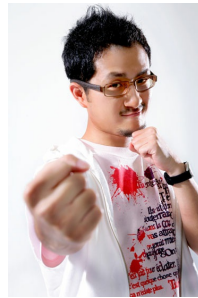
創作不懈的九把刀圖片

正是因為這樣未知的挑戰，讓我們用其他的方法想更加了解自己，這兩篇故事都是以台灣為背景，說的是身邊最有可能發生的事情，九把刀善於處理周遭的小事情，使其成為一篇篇引人入勝的文章，或許是他社會學的背景，讓它在字裡行間富含哲理，讀者在咬文嚼字後，還能夠深深思考故事中隱含的小啟示，《大哥大》這本書其實延續了都市恐怖病的系列風格，吉六會、柚子等以前在《冰箱》曾出現過的角色，在這裡又重新再現，讓我們不得不佩服九把刀的商業頭腦，因為如此天馬行空的幻想，若有似無的連載，讓書迷繼續期待下一本都市恐怖病。