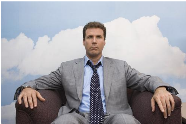
主角哈洛德·克里克，這時的他不斷地聽見旁白的聲音。