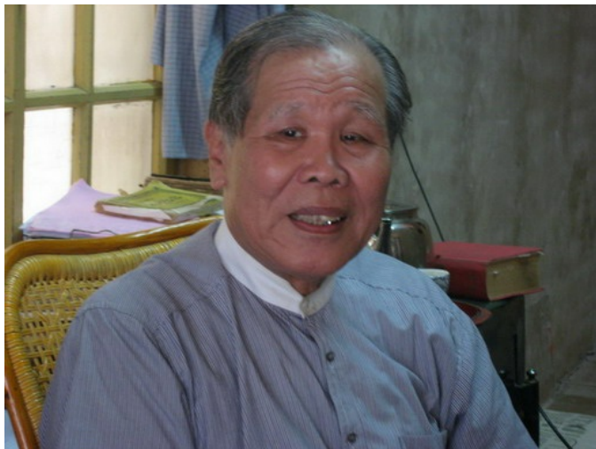
圖為詩人蔡中村，目前擔任中華民國傳統詩學會名譽理事長等各學會要職。