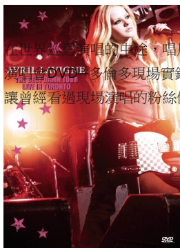
《美麗壞東西世界巡迴演唱會DVD—多倫多現場實錄》

艾薇兒08年美麗壞東西世界巡迴演唱會，前陣子以北京作為壓軸場，結束了長達七個多月的巡迴表演。三月即從故鄉加拿大起步，艾薇兒跨足歐美以及亞洲各國，總計一百一十七場演唱會，其中也包含了台灣。然而與海尼根合作舉辦的原裝酷樂演唱會，在台北中山足球場落幕後評價不一，有歌迷抱怨只有短短七十五分鐘，令人失望，但也有歌迷始終支持艾薇兒，甚至期待她再次來台開唱。