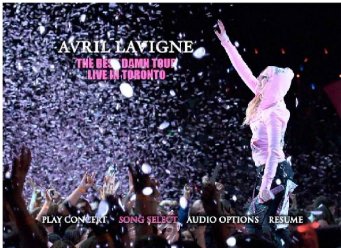
《美麗壞東西世界巡迴演唱會DVD—多倫多現場實錄》主選單 圖：黃湘茹