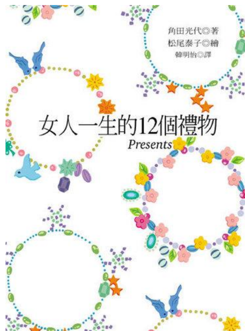
角田光代的《女人一生的12個禮物》。

她，作者角田光代，在認真地思考後寫下了這本書，這是一篇篇給「女人的12個禮物」。或許在書架上，看起來不過是一本心靈勵志書籍，但是一翻開，卻可以發現書中一篇篇的「禮物」不僅令人感動，甚至可以讓人思考不同的現代女性角色問題。