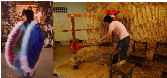
參觀、體驗地方文化，品嚐當地美食。