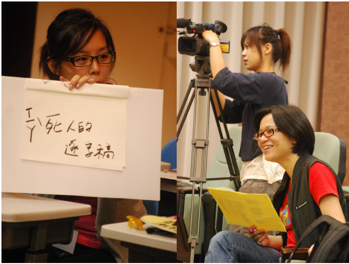
體驗專業，我們在各大傳播相管領域實習，舉辦實習展，表現所學。