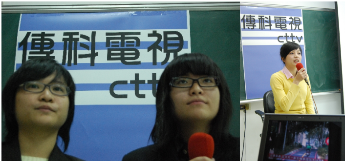
我們學著作新聞，從發現議題、採訪、後製，到拿麥克風當主播。