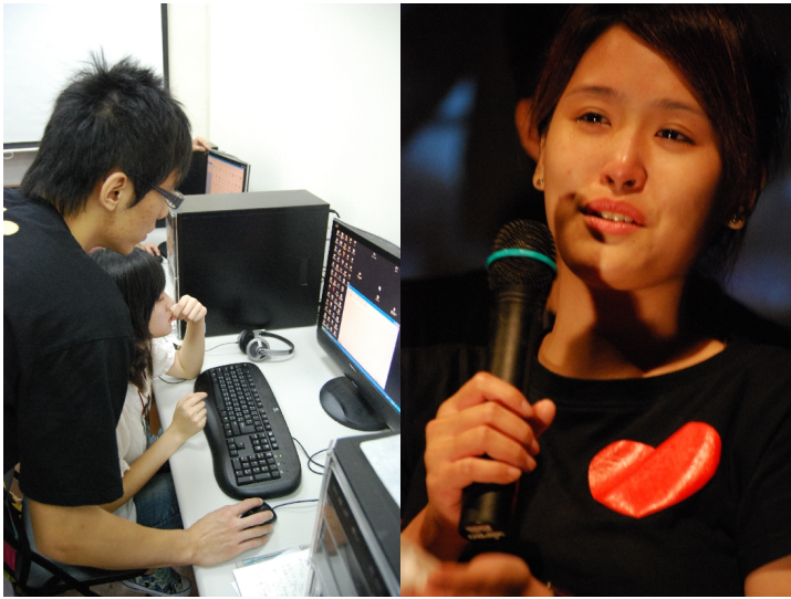
我們舉辦營隊，試著把我們學到的交給高中生，讓他們體驗傳播媒介。