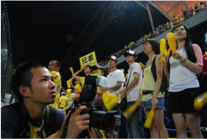
台中洲際棒球場，熱血職棒冠軍賽，球迷專注的為支持球隊聲嘶力竭，我們為了作品，當冷靜的紀錄者。