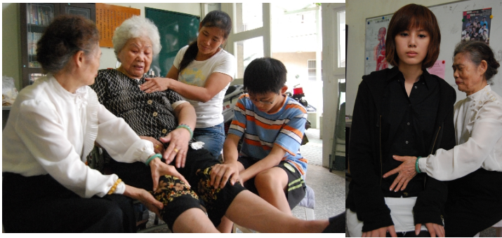
為了深入了解民俗療法，親身嘗試。