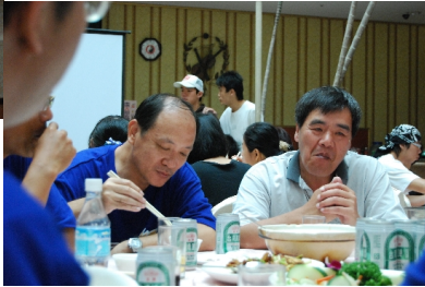
接case，扛著電腦到校外熬夜剪片、飯局上，當他人酒酣耳熱，我們拿著站在一旁用像機紀錄他們的聚會。