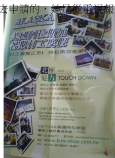
國際服務中心張貼有關信息的海報。

每個人在一個陌生的地方都會感到害怕，而處在一個不同文化的環境會遇到的困難可能比平常還要多，在上班時雖然會有來自相同地方的人分