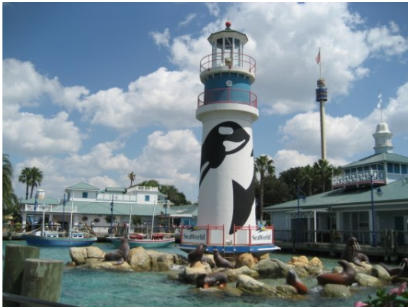
圖為美國打工其中一個主題樂園。

大學生無疑是最自由的一個年齡，在大學生的生活裏沒有太多的管制，而且也沒有多大的社會壓力，各方面的能力都屬於中等，但卻是一個完全獨立自主的年齡。是一個可以自由去做自己想做的事的年齡。大學生的生活一直被認為一定要修滿三個學分，這三個學分相信大家都很清楚，學業、愛情、和社團，但最近應該還要多一個，那個就是開拓國際視野。