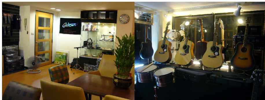
世界樂器行在努力2個月之後的成果。