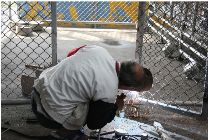
被遺棄的動物越來越多，工人要趕快完成新的籠子，好讓牠們有個棲身之所。