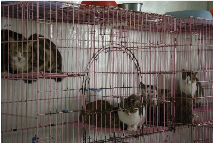
收容所裡還有不少的貓，牠們的數量約是狗的八分之一，每一隻都很安靜的坐著、睡著，就算有人出現，也只會默默地看著對方。