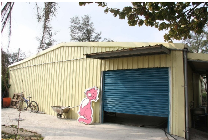
流浪狗居住的區域暫時有三個，住在A跟B區是健康的動物、然而C區（黃色鐵皮屋）是隔離區，讓有疾病的狗隻遠離人群。