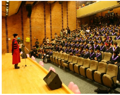
大學畢業了，卻不見得每個畢業生都清楚自己未來的目標 圖片來源：清華大學

當研究所出現大學化的現象，碩士的素質是否隨著降低？教育資源如果沒有隨著研究所人數擴增，在有限的資源下，每個研究生所能分配到的資源也縮水；許多碩士生只是求畢業的文憑，而非對研究的熱忱，以致出現論文水準降低的現象；而當研究所畢業生的素質不夠，也不見得憑著碩士學歷就能領高薪。當使用較多教育資源的碩士生只能做原本大學畢業生即可做的工作時，除了造成資源浪費，也造成了只擁有大學學歷以下的人口就業問題。