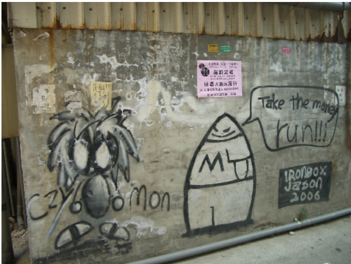
那麼，我不汲汲營營，誰汲汲營營？