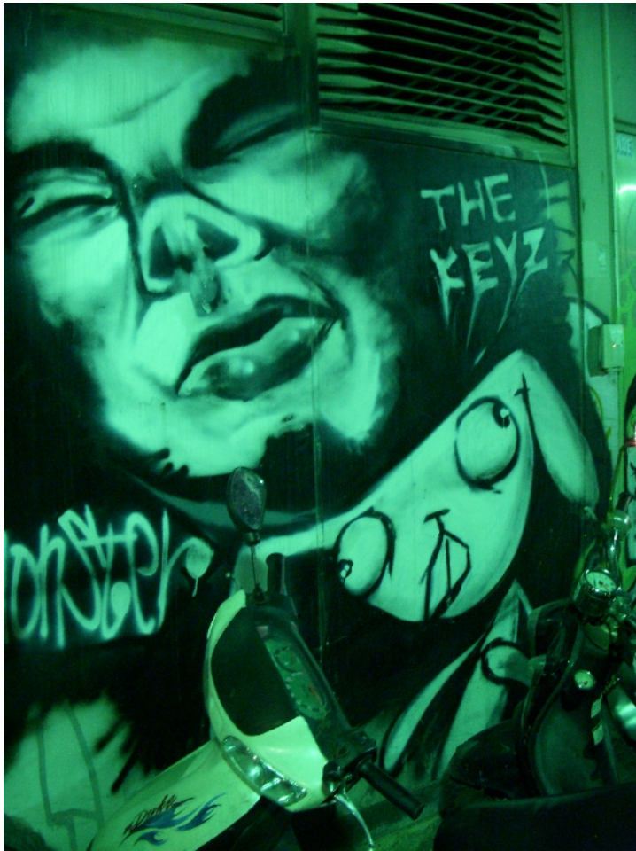
鐵灰色的不景氣， 讓廉價成為勞工的專有名詞。