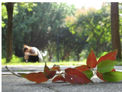
學校寧靜的一角，極具詩意。