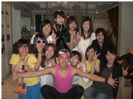
十二月初前往阿宛家的大明星生日PARTY，聚會永遠是開心的。