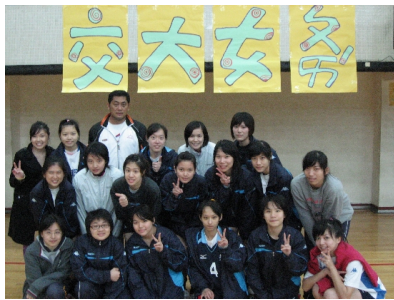
大專盃結束球隊全體人員合照。 排陪練員