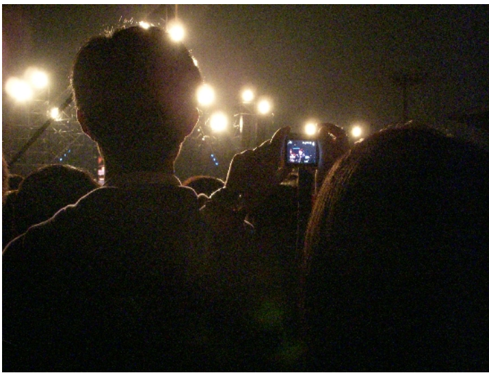
五月天演唱會的歌迷用相機攝影。

年終將近，演唱會一場接著一場，不僅替跨年晚會先暖了身，更是趕走了不景氣的憂鬱氣氛。12月13號中山足球場，是五月天巡迴演唱會的第一場表演，場內歌迷一同尖叫吶喊讓現場氣氛嗨到最高點，歡騰舞動似乎驅走了冬天的寒冷。然而，歌迷手中搖擺的卻不再是螢光棒，而是手機相機的快門。當歌迷的支持只剩下鏡頭的注視，現場感動也變成了存檔紀錄時，行動科技的進步似乎正悄悄地影響了表演生態。