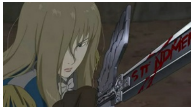
降臨於D'eon身軀的Lia靈魂，以劍和詩篇展開復仇。

故事設定在法國大革命之前路易十五的王朝。巴黎寧靜早晨的河畔邊，發現了一艘載著木棺的小舟，裡面裝著故事主角D'eon的姐姐——Lia的屍體。Lia作為效忠於路易十五的優秀騎士，出外執行任務卻死於不明原因。木棺裡的遺體無法腐化，Lia也不能下葬，於是亡魂徘徊於人間，降臨在D'eon的身上，展開一連串的報復。而D'eon在接受靈魂的同時，體會到了無可以比擬的悲憤，為了使Lia的亡魂得到安息，D'eon加入了路易十五的機密局nqm，自此一步步揭開潛藏在Lia死亡背後醜陋卻又無法歸罪於任何人的悲劇真相。