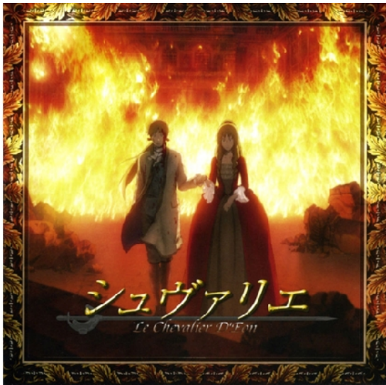
以燃燒的宮殿象徵王室衰亡，D'eon與Lia為時代下堅守騎士之道的悲劇人物。

以路易十四之名榮耀的法國歷史，王室光輝隨著路易十六的頭顱在斷頭台上掉落而終結。人民思想解放，以革命對法國王室展開腥風血雨的報復。然而長久以來服從於王權的騎士，遙久以前即面臨效忠王室與自我道義抉擇的兩難，不滿與憤怒在忠心之名下沒有盡頭，最後只能隨著王朝消亡而散去，其中的悲哀無人知曉與關注。《Chevalier》則藉由騎士之名，刻寫王國封建下，騎士忠義難全的無奈。