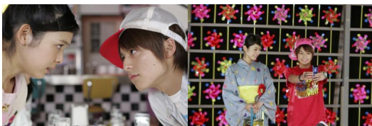
劇中理沙和敦士鬥嘴吵架的一場熱鬧的廟會，理沙試圖畫畫。圖片來源：奇摩電影 找機會告白。圖片來源：奇摩電影

不同於「少男漫畫」以男性為主要訴求對象，漫畫劇情通常是直線進行，且大部分是由「努力、友情、勝利、熱血」等幾個關鍵字組合而成的故事。重要的戰鬥劇情，主要是為了守護世界和平、打敗邪惡壞人而戰，最終都是在一番激戰下，主角大逆轉獲得最後勝利，整個敘事過程簡要且單純化。由此可見，和上述「少女漫畫」所呈現的故事內容，成為極大的反差。