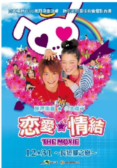
《戀愛情結》電影宣傳海報。

一部自日本漫畫改編而成的電影，破除社會大眾戀愛畫面的刻板印象，「女高男矮」的有趣畫面牢牢地抓住眾人的目光。片中精彩的視覺特效、電影男女主角的外貌長相、搞笑的精華片段等，在影迷的心目中早已成為次要因素。藉由此片，日本漫畫文化再一次成功地打入各地文化藝術市場，證明「通俗劇情」是永遠被接受的故事內容。