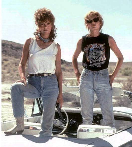
兩人最後一反亮麗形象，成了抗拒父權的女戰士。

隨後就進入了影片後期，剛開始逃亡時泰瑪還是不忘給丈夫打電話，丈夫對她大吼大叫要她回來，象徵性的描述出社會父權主義的氾濫，女性的不被重視，但是後來卻出現了極大的諷刺，當他們逃亡中要泰瑪打給他丈夫以試探警察是否已經發現並監聽他們家電話時，泰瑪一聽到丈夫溫柔的問候時立刻掛斷電話說：「電話已經被監聽了。」這說明了之前她的丈夫對她有多不客氣，以至於今日突然的溫柔立刻被識破。逃亡途中她們遇到了保釋犯JD，泰瑪在這裡開始擁有性的自主權，選擇了與JD發生一夜情，之後開始持槍搶劫，用槍指著攔下他們警察的頭，甚至對性騷擾的卡車司機開槍。