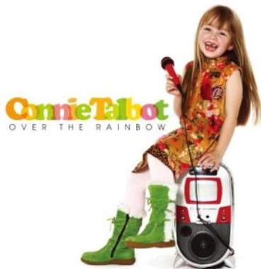
圖為小康妮第一張專輯《Over The Rainbow》的封面。

唱片工業蕭條，唱片銷售量急速下滑，雖然歌手輩出，但是可能人們已聽習慣這些愛情歌曲，加上消費者越來越會精打細算，沒有太大特色的唱片根本難以刺激買氣。這時候，唱片業市場卻出現了一些不同的「聲音」——那，就是兒童歌手。亮麗的童音加上俏皮天真的模樣，兒童歌手的出現無疑為唱片業市場注入了新動力。