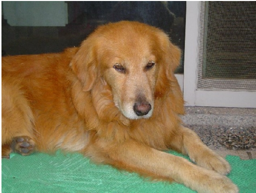
收容所中充滿著等待領養的名種狗。

一波災難。台灣的「名犬熱門風」，從熱門電視劇、感人肺腑電影的明星動物米格魯、拉布拉多、哈士奇到早期古代牧羊犬、杜賓狗、大麥町等等，無一不成為收容所的常見面孔。因此，電影《與狗狗的10個約定》中不但推廣以認養代替購買，以結紮代替撲殺的觀念，與狗狗的這十個約定也已經在世界各國形成為尊重生命的基本宣言，十項約定是為了提醒所有想要飼養寵物的飼主在此之前，別因為看了電影或一時衝動趕流行，未經縝密的思考就擅下決定，造成一個生命未來的遺憾。