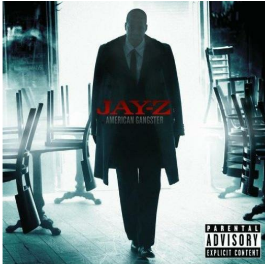
《American Gangster》是Jay-Z的第十張冠軍專輯。

Hiphop文化從八零年代興起後，就引領著美國青少年的生活走向，並蔓延至全世界。Hiphop文化中最重要元素是音樂，饒舌音樂以及混音技巧成為Hiphop的代表，在這樣的嘻哈音樂市場中，JAY-Z可被稱為近十年來穩做王位的嘻哈歌手，《American Gangster》這張專輯的銷售量讓他追平了貓王的10張冠軍專輯的紀錄。