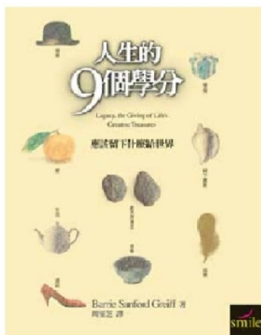
左為原文封面與書名。右為十週年再版封面