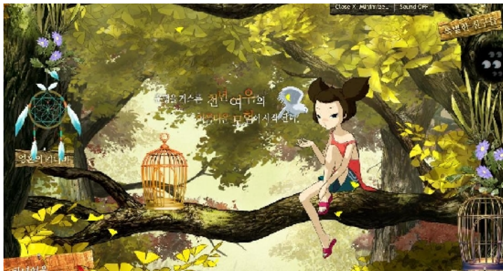
官方網站的畫面

《千年狐》/《五尾狐》這個名字看起來彷彿是中國的傳說故事，但其實卻是由韓國製作，結合神話、科幻以及懸疑的動畫大作！故事以千年狐優比與男孩金梨之間的情誼為主軸，描述若優比想變成真正的人類，但卻需要得到一個藍色的人類靈魂。