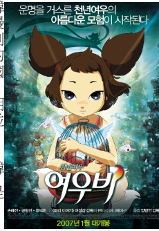
電影海報

若大家還不熟悉韓國的動畫，而透過這一部可以讓你了解到現在的韓國動畫發展，其實並不輸於其他正在發展動畫產業的國家——甚至是一些動畫發展完善的國家！