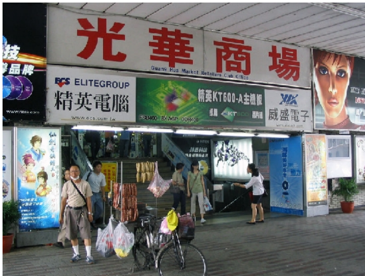
從前老舊的光華商場，是今已不復見的景致。