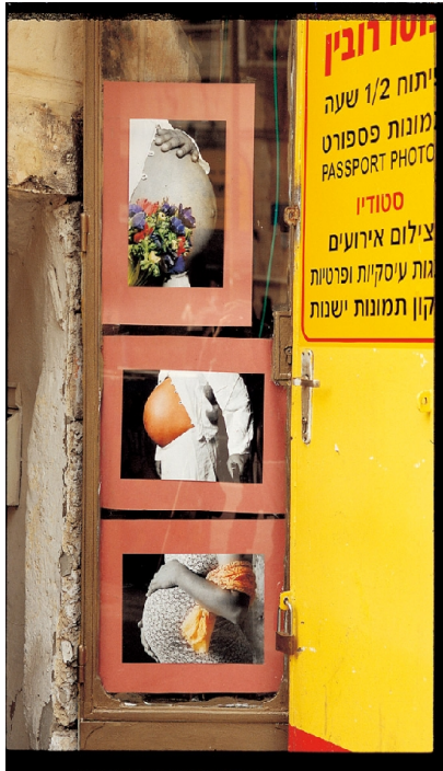
在以色列，根據猶太教的極端教義，女性必須不斷的懷孕來製造後代。

女性在世界各地受到不同的社會背景與文化影響，處境也不盡相同；但是當她們面對家庭的束縛和時代的變動，卻遭受到相似的考驗。來自十二個不同國家、不同成長背景的女人們，在《她的故事》中透過一張張相片與文字，除去了歷史加諸於女性的種種偏見，呈現出屬於當代女性的獨特魅力。