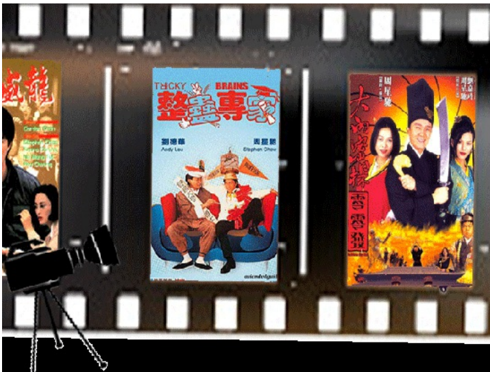
這二十年來，周星馳電影都廣受人們的喜愛，他到底具備了甚麼魅力呢？

每當人們提到喜劇電影都會想到「星爺」周星馳，這位人物在他所主演的每一齣電影，台詞常常成為年輕人的流行用語，甚至形成一種獨特的「周星馳現象」，引起人們的討論。