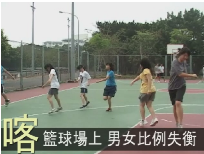
交大室外籃球場上，傳科系女籃的隊員們正在進行基本動作的訓練。

礙於先天上的限制以及社會價值觀的認定，在球場上幾乎很難看見女生的身影。因為籃球碰撞的特性，比一般運動更難吸引女生參與。如今性別意識抬頭，女籃也開始脫離過去次男籃的形象，打出屬於女生的籃球賽。球場上男生雖多，還是有一群熱愛籃球的女孩在努力練習著。對每一個女性籃球員而言，打球的快樂與權利是不能因為性別的差異而被剝奪的。