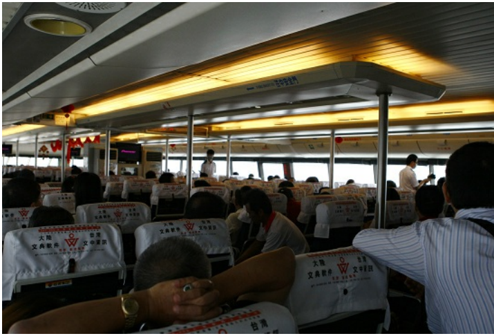
所有入境的班機、船班等皆配合檢疫人員進入檢查。