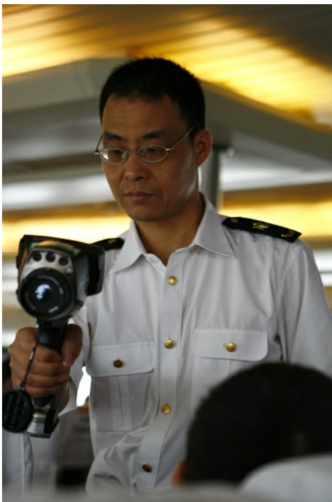
一名海關檢疫人員正以一台手持體溫計為每位乘客量測體溫。