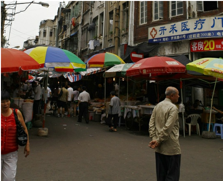
人口高度密集的市場、車站與商家賣場等，將會是傳染病高度蔓延爆發的地區。