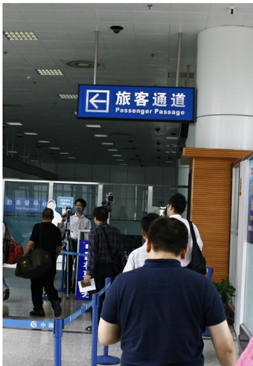
當旅客要入境的第一關，還需經過有更高靈敏度的體溫感測劑進行檢查。