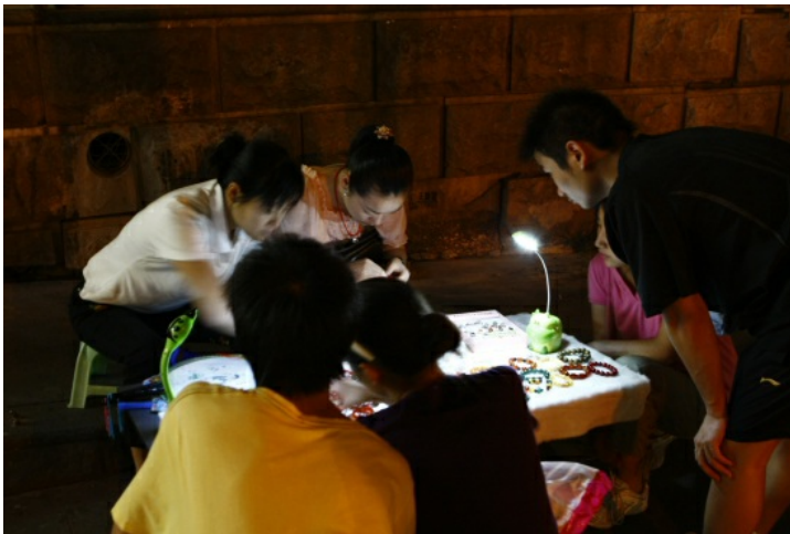
過於頻繁及近距離接觸的人際互動，將會加大傳染疾病的機會。