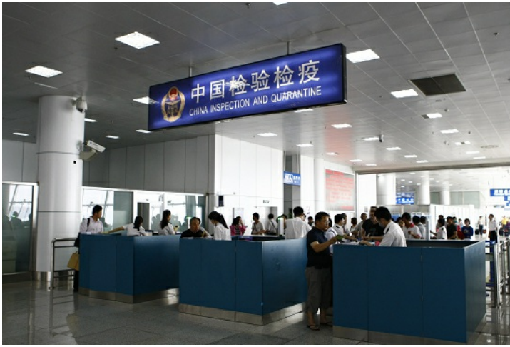
最後經過海關檢驗檢疫，並再經過一次海關查驗與體溫量測，才進入證照查驗的手續。