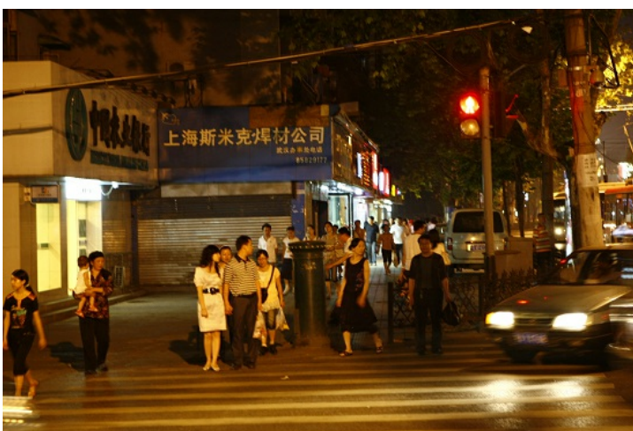
然而如今大部分人們對於傳染病的認知依舊不夠了解，並持續維持著原來的生活模式。而人口高密度的城鎮該如何有效推廣與疫情控制，將是關鍵。