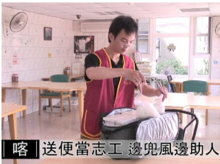
交大學生自願做送便當志工，為獨居和低收入戶的老人送餐。 影片截圖／梁素茵

新竹社會處有一項「老人送餐服務」專案，採取官辦民營的方式，與伯大尼老人護養中心合作，為獨居或低收入戶的老人提供送餐服務。交大有幾名學生，因為這項志工服務可以“走出校園”，同時又能幫助弱勢老人，於是每個禮拜都挽起便當袋，為社區老人送餐。