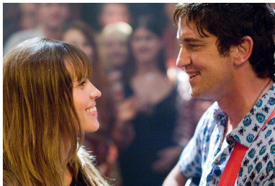
◎傑瑞對著荷莉唱情歌。

人們常說，愛爾蘭的男人都長得又帥又迷人，事實果然不假，劇中傑瑞貼心的為荷莉及她的兩個好友安排了一趟旅行，讓她們重遊兩人相識的愛爾蘭。旅途中，荷莉遇到了一位令她再次心動的男人威廉，結果發現他竟是傑瑞的拜把好友，在如此尷尬的情況下，荷莉最後選擇相信一切都是傑瑞策劃好的，因為傑瑞寧願讓荷莉得到照顧，也不願看她一人孤獨終生。