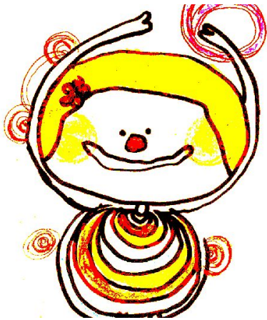
戀家又愛做白日夢的大三生。

不過，妳們從未把對方當成一面鏡子，渴望從對方身上映照出自己的人生，看見彼此的未來，因為妳們知道，妳們真的很不一樣。