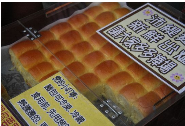
籃子裡的麵包一顆一顆整齊排列著，每賣出一顆，他就可以賺十塊錢。