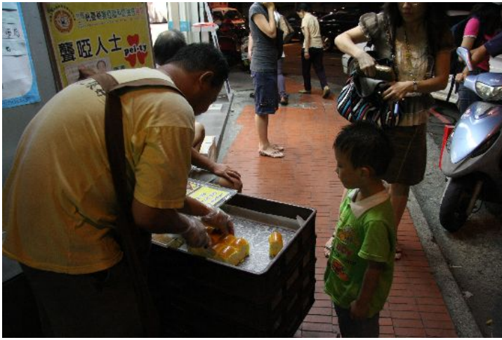
小男孩要他媽媽買兩個麵包，朱明燦小心翼翼地切給他。