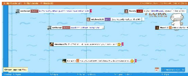
噗浪時間軸介面擬像化有如河道。

微網誌由於架構平易近人, 因此成為繼facebook後, 使用者成長最快的社群。其中, twitter是目前全球最多人使用的微網誌, 著名的例子則是如美國總統歐巴馬成功應用twitter的競選策略, 讓選民認識他的私生活並強化互動而贏得認同及相信改變的可能。但是twitter目前沒有中文的介面, 在台灣最為風行的是plurk(噗浪)。