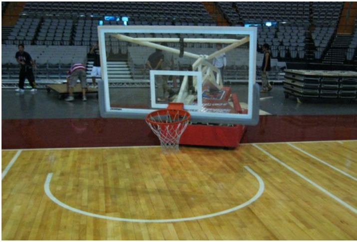
籃球架，整場賽事的主軸。