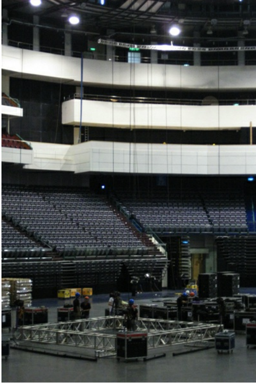
未成型的中央大螢幕，組裝看似容易實際卻最費人心神。