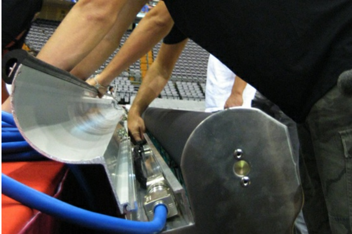
工作人員齊力組裝活動廣告看板。