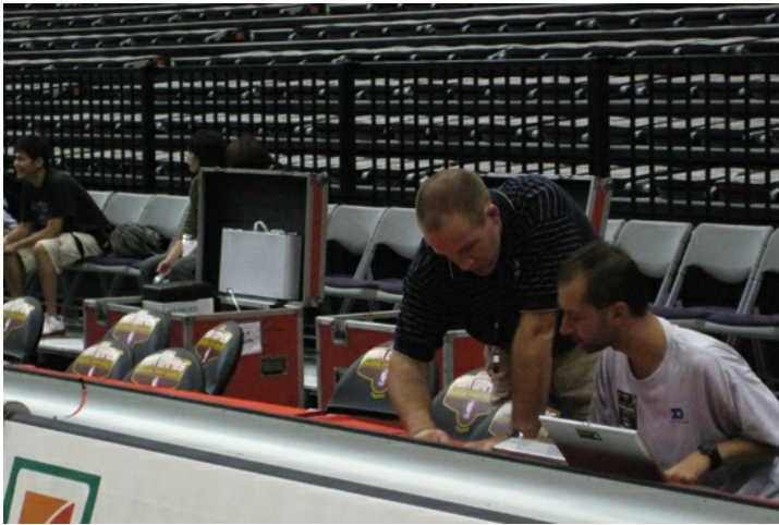
擔任播報台的國外專業人員。