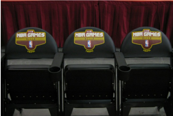
以高級的皮坐墊椅迎接十月八日來台的NBA球員。

NBA熱身賽來台，於十月八日在台北小巨蛋開打，在光鮮亮麗的舞台背後，藏著這場賽事的最大功臣——來自各地的工作人員。