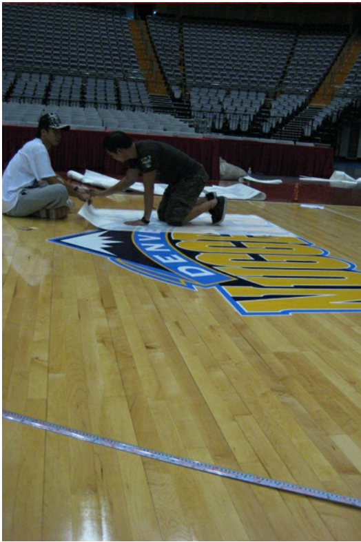
地板的LOGO貼紙為整個籃球場注入靈魂。