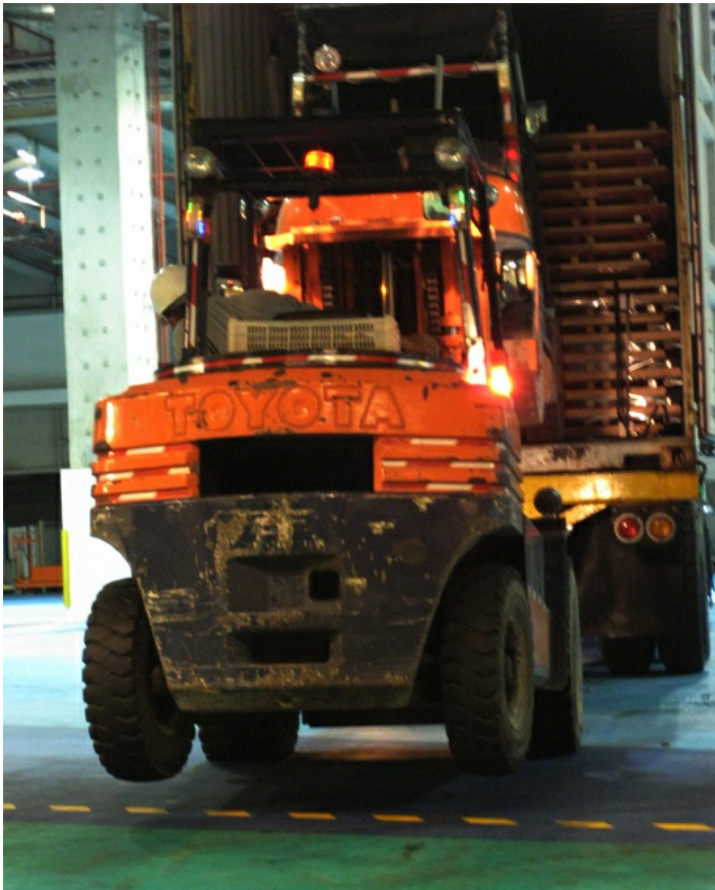
利用兩台起重車的方法，將貨櫃內部的貨物運出。