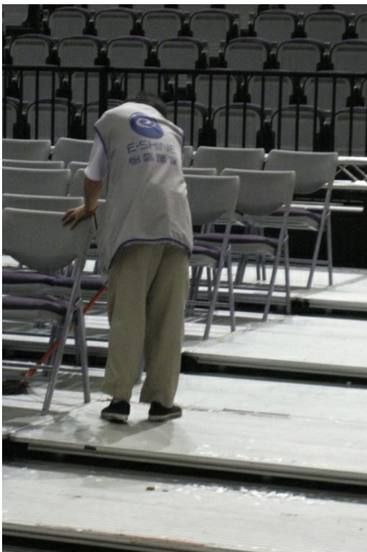
默默為NBA台北賽付出的清潔人員。