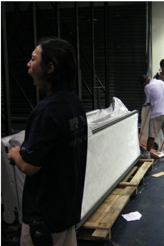
工作人員多天的疲勞不時浮現。