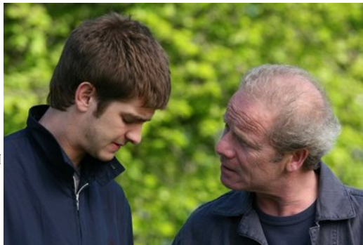
對童年陰影揮之不去的傑克與監護人泰瑞。

隨著故事進行，傑克在泰瑞的幫助下逐漸找到適應這個社會的方式，他認真的投入工作，結交新夥伴克里斯，也順利與喜愛的蜜雪兒交往，或許面對人際關係仍略顯生澀，但在友情和愛情的滋潤之下，他已經慢慢找回自己在社會上的價值，努力地在成為「傑克」。傑克和許多出獄的受刑人一樣，即將展開一段新人生，台灣社會稱之為「更生人」，因為他們的生命被早已被更新。台灣成立很多輔導更生人的團體，希望能幫助他們適應這個社會，並找到一份合理的工作讓他們可以養活自己，成為一個獨立的新人。不過，大家準備好了嗎？台灣社會真的可以接受像傑克一樣的新人名了嗎？而真實的人生是否又能接受他們再一次的更生？