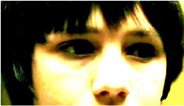
隱藏傑克心靈的鐵窗依然緊緊的關著。

整部片的尾聲，逐漸沒有對話，只剩下傑克不斷奔跑找尋出口的畫面，他備受離棄和一個人的孤寂讓他發現新的名字「傑克」並無法讓他成為另一個人，因為在大家的心裡，他仍然是當年的殺人兇手——艾瑞克。究竟心靈的鐵窗裡面關的到底是誰，依賴友誼勝過真理的艾瑞克，理當擁有嶄新人生的傑克，還是知道真相就會對另眼相看的眾人？