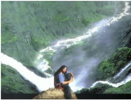
專輯《Confluence》封面。

樂器保留獨一無二的特點，透過合奏凸顯中西音樂的音色，「希望聽眾們能聽出這些東方樂器與西方樂器間的關聯性，又不失本有的特質。」他在專輯後記裡這麼說。文化的交融，音樂的結合，記錄著大地最真實的樣貌，聽眾就這麼如痴如醉地徜徉在馬修連恩鋪陳的美麗大地裡流連忘返。