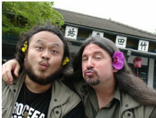
馬修連恩(右)在台灣客翻天節目中到屏東竹田與客家的第一次接觸。

專輯《旅客》的呈現，是國際與在地音樂碰撞出的燦爛火花。馬修連恩用一年時間走訪竹田、大埔等客家莊，實地收錄了客家藝術的瑰寶，用客語吟唱著義民塚的悲壯之歌、用山歌唱響採茶農家的田園樂、用二胡和嗩吶奏著藍調風味的八音，還有客家民謠、戲曲、和傳統創作等等。在客家電視台《台灣客翻天》節目中，將這些差點被遺忘的精彩歌調和動人故事與觀眾分享。他集合在地音樂家的聲音，不在乎音準和節拍，而是對客家族群的關懷和對傳統文化的熱情，以一個外籍音樂家的眼光，詮釋這些真誠的聲音，並融入新樂器、調整編曲，跳脫語言的框架，在音樂的殿堂裡重新為在地凝聚力量。這張專輯獲得二〇〇八年金曲獎的肯定，不僅《旅客》大放異彩，也讓攜手合作的客家音樂家增添光彩。