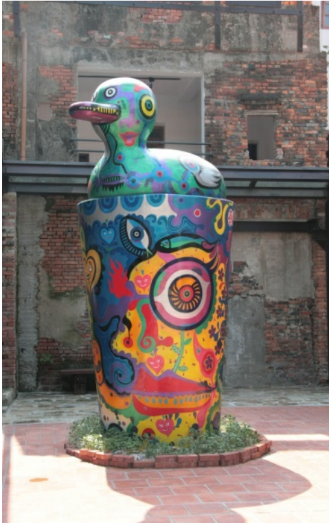
在磚瓦堆成的背景中，當代藝術品格外醒目。 (藝術家：洪易)