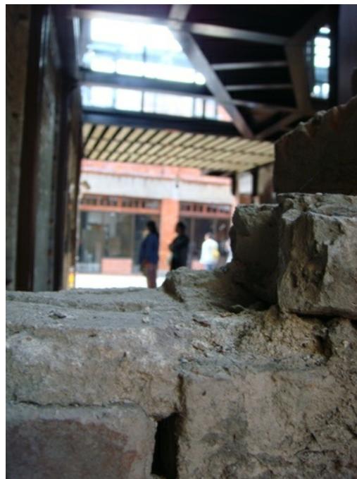
從殘垣中窺見前來欣賞的剝皮寮新風貌的遊客。