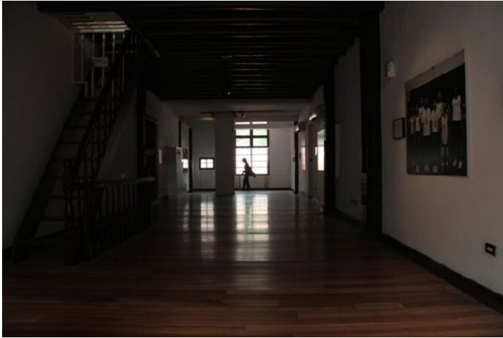
展場內部設計簡潔而寬敞。