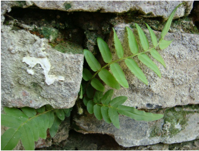
縫隙中長出蕨類。

歷史的一切都是假的，歷史的一切都是真的。 在宛如輪盤旋轉的思想中，新舊交疊出當代的真實。