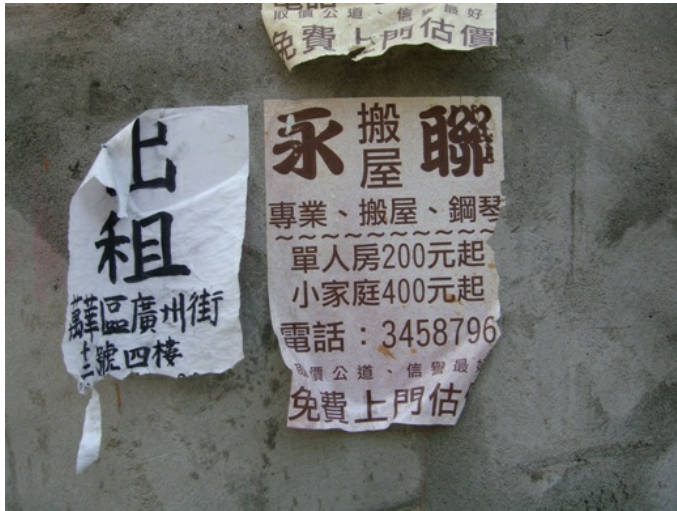
斑駁的舊廣告是台灣市井小民的最佳代言人。

重新活過來的剝皮寮老街帶著上一代的懷舊記憶，注入了下一代人的心中。透過剝皮寮老街，年輕人也懷舊，對那個老老的年代抱有一份想望。