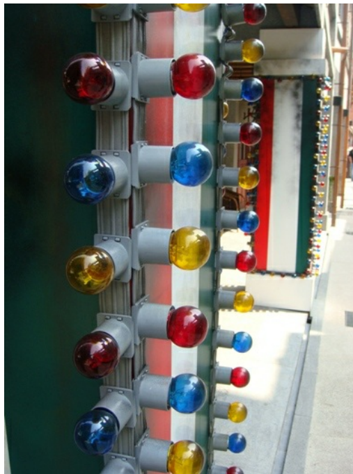
色彩斑斕的燈泡讓人感到「俗俗仔美」。