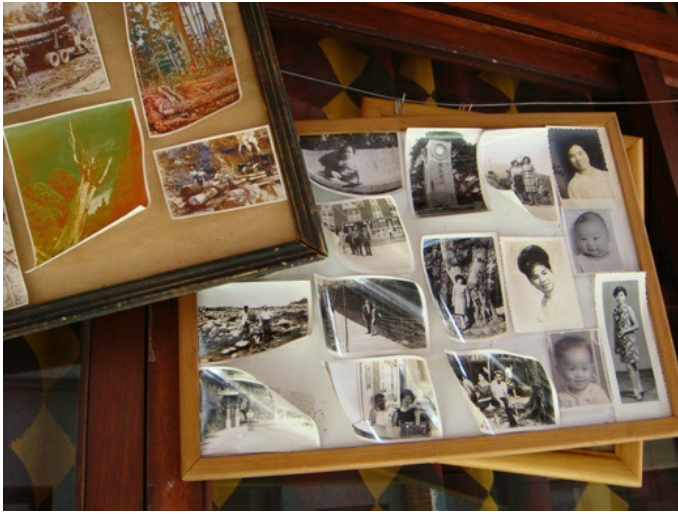
懸掛起來的老照片，企圖喚醒一種對於時代的集體記憶。