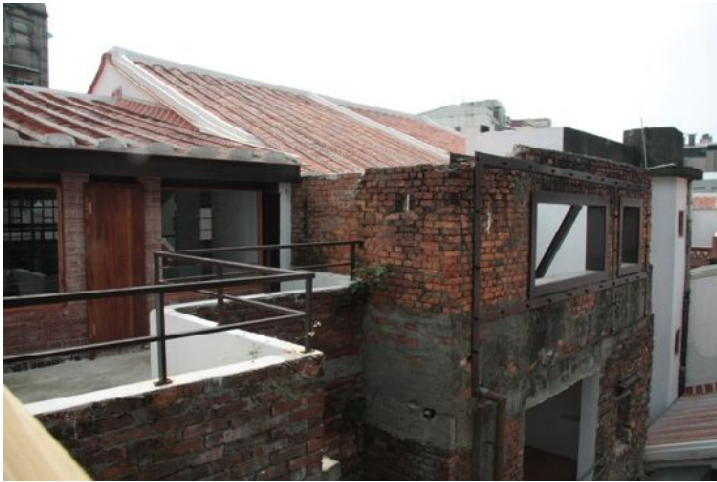
現代風格的玻璃和鋼筋巧妙地隱身於紅磚瓦中。