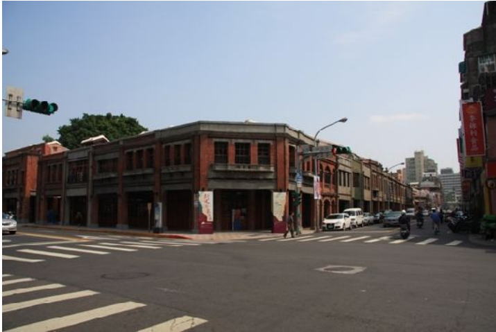
剝皮寮老街經北市府整修後以「剝皮寮藝條通」的名義再度出現世人面前。

剝皮寮街位於台北市萬華區，清朝統治時期從此處為運送杉木的轉運站，杉木聚集於此，剝下樹皮、初步加工處理後再往內陸運送，因而得到了乍聽之下極為駭人的「剝皮寮」之名。