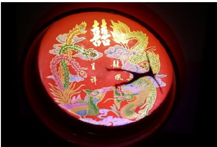
將喜盤倒影上剪影的裝置藝術。

歷史的一切都是假的，歷史的一切都是真的。 在宛如輪盤旋轉的思想中，新舊交疊出當代的真實。