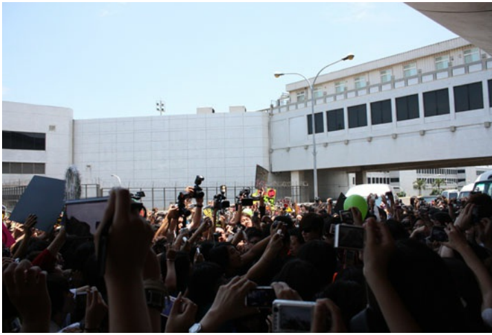
歌迷包圍SS501保姆車的行動，可能影響社會對SS501歌迷的認知。

其實即便是同一團體的迷群，其組成還是有其異質性，當今迷文化的發展面向，也早已脫離偶像崇拜的範圍。對許多人來說，它是生活中的一部分，提供情緒的寄託與自我認同的場域。韓國偶像團體的迷群文化透過共有名稱與色彩，而產生特有的緊密結構，為迷偶像的行為添加更多情感上的意義。然而卻也更容易形成感性的沉溺，甚至有以團體之名，行少數代表多數的行為。依然在同一屋簷下的歌迷們如何自處、又該如何解決團體中的問題，值得討論；而隨著沒有停歇之意的韓流風潮，這些迷群團體在台灣會以何種趨勢繼續發展，也有待持續的觀察。