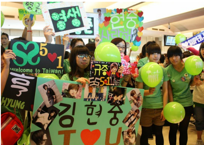
SS501歌迷後援會特地訂製綠色制服，表現他們對偶像的忠誠。