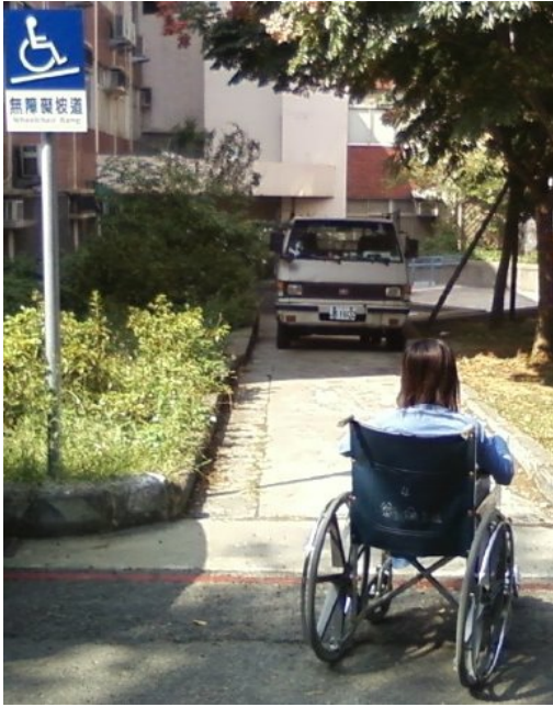
貨車總是蠻橫地佔據殘障坡道入口，造成行動不便者的不便。

總是要先克服許多障礙才能使用無障礙空間的校園，讓女孩每天都面臨重重阻礙，電梯似乎解決了上下樓層的問題，但是電梯的寬度根本無法容納輪椅；殘障廁所似乎解決了生理需求，但是廁所門的寬度卻無法讓輪椅進入；降低門檻似乎解決了推輪椅的難度，但是卻沒有設置斜坡克服地面和門檻的落差；殘障坡道似乎解決了行動不便的障礙，但總是設計在距離門口最遠處，而且貨車時常蠻橫地佔據殘障坡道入口；主要通道出入口的水泥路障目的在於阻擋機車進入，卻連帶阻擋輪椅通行，行動不便反而必須沿著校園環繞一週才能到達教室；以石磚鋪設的地面造成路面崎嶇顛簸，輪椅難以通行，即使強行通過，路面造成的輪椅震動不斷增加傷患的痛楚；無障礙空間總是出現在建築物的某一側，如果目的地在另一側，只好認命地推著輪椅尋覓無障礙設施。再次拐腳的女孩，傷勢每況愈下，無法自行走路的她，坐著輪椅卻力不從心。