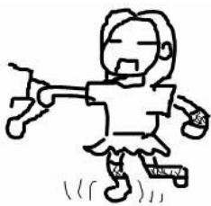
女孩身邊每一隻溫暖的手，都帶給女孩無限勇氣。（圖片來源／林乃絹）

總是要先克服許多障礙才能使用無障礙空間的校園，讓女孩每天都面臨重重阻礙，電梯似乎解決了上下樓層的問題，但是電梯的寬度根本無法容納輪椅；殘障廁所似乎解決了生理需求，但是廁所門的寬度卻無法讓輪椅進入；降低門檻似乎解決了推輪椅的難度，但是卻沒有設置斜坡克服地面和門檻的落差；殘障坡道似乎解決了行動不便的障礙，但總是設計在距離門口最遠處，而且貨車時常蠻橫地佔據殘障坡道入口；主要通道出入口的水泥路障目的在於阻擋機車進入，卻連帶阻擋輪椅通行，行動不便反而必須沿著校園環繞一週才能到達教室；以石磚鋪設的地面造成路面崎嶇顛簸，輪椅難以通行，即使強行通過，路面造成的輪椅震動不斷增加傷患的痛楚；無障礙空間總是出現在建築物的某一側，如果目的地在另一側，只好認命地推著輪椅尋覓無障礙設施。再次拐腳的女孩，傷勢每況愈下，無法自行走路的她，坐著輪椅卻力不從心。