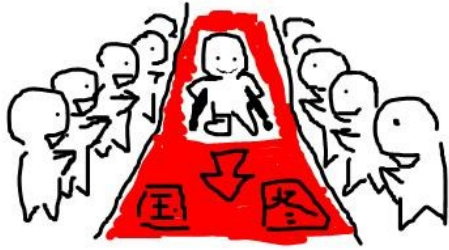
拐腳女孩到國家圖書館瞬間成了眾所矚目的焦點，所有義工全體總動員。

當石膏換成橡膠的輕石膏，當拐杖旋轉跳躍駕輕就熟，當輪椅蛇行甩尾收放自如，女孩開始接受生活中各式各樣的挑戰，就像學會依賴拐杖快速上下樓梯，就像坐著輪椅到國家圖書館調閱論文完成研究方法報告，就像扛著拐杖騎機車到竹北買北海道戚風蛋糕，就像拄著拐杖到人山人海的資訊展覽筆電，就像國際志工說明會的講師竟然坐在輪椅上，就像為了完成新聞專題在校運會會場架起攝影機當拐腳攝影師，就像拐腳二人組一起拄著拐杖進KTV夜唱，一切，似乎靜靜地回到正軌。