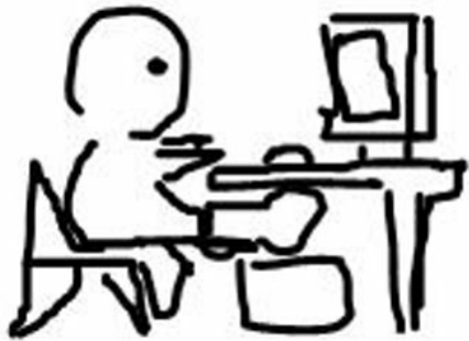
電腦主機放在地上的功用，原來是讓拐腳女孩跨腳。

當石膏換成橡膠的輕石膏，當拐杖旋轉跳躍駕輕就熟，當輪椅蛇行甩尾收放自如，女孩開始接受生活中各式各樣的挑戰，就像學會依賴拐杖快速上下樓梯，就像坐著輪椅到國家圖書館調閱論文完成研究方法報告，就像扛著拐杖騎機車到竹北買北海道戚風蛋糕，就像拄著拐杖到人山人海的資訊展覽筆電，就像國際志工說明會的講師竟然坐在輪椅上，就像為了完成新聞專題在校運會會場架起攝影機當拐腳攝影師，就像拐腳二人組一起拄著拐杖進KTV夜唱，一切，似乎靜靜地回到正軌。