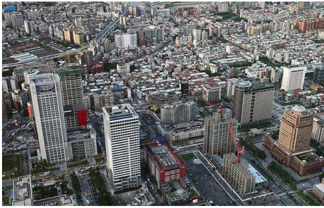
台灣擁有宏偉的商業高樓大廈，卻少了安靜、沉的住氣的建築。

近年來，台灣大眾與政府開始重視公共空間，加上建築師持續推廣「公共性」觀念，台灣的公共建築開始接觸社會大眾，由公共建築形構出地方核心連結當地居民的認同感。雖然過去邱文傑曾因公共建設的案子遭受狀害委屈，但他仍然喜愛參與公共建築設計，台中「九二一地震教育園區」、新竹市「東門之心」和南投「紙教堂」都是他的獲獎作品，帶領台灣公共建築進入一個全新的領域。透過建築的穿針引線，希望能縫合台灣公共建築的瘡疤、跨越歷史的鴻溝，讓人民對公共建築有不同的想法及態度轉變。他說，公共建設牽涉到眾人的生活，可以走進社會做互動，比蓋一棟私人住宅還有趣，也更有意義。建築師不應該只待在象牙塔，而要走出去接觸這個世界，呼吸外面的空氣、關心社會的脈動，因為每一棟建築物除了軀殼，更需要靈魂，被人類真心的喜歡、融入大眾的生活。「蓋房子不是為了得獎，更不是為了自己，而是為了社會大眾。」只要大家喜歡他蓋的房子，他就會很高興。