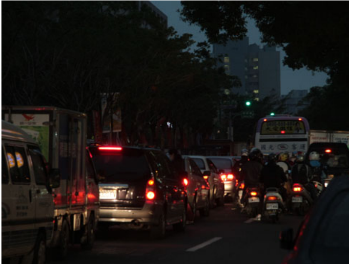
下班時間，光復路顯得非常擁擠。

光復路因為連接著國道高速公路和新竹市區而成為新竹的交通樞紐，有許多客運會在這條路上載客。新竹科學園區就在附近，清大也位於這條路上，而清大的對面又是熱鬧的清大夜市，使得這條路在顛峰時間十分擁擠。每當到了禮拜五，很多清交大的學生都會搭客運回家，客運因此加開班次，讓原本車輛就多的光復路更顯得擁擠。