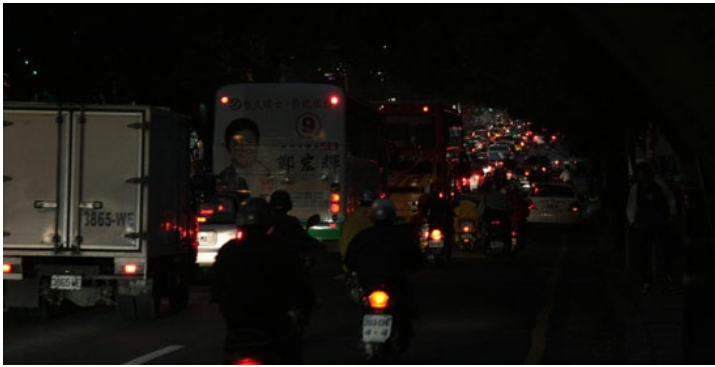
壅塞，延伸至市區。