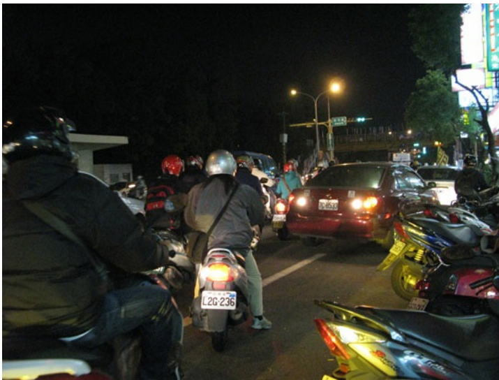
汽車與機車爭道。