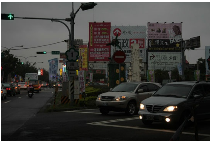
車輛經國道高速公路交流道下到光復路。

光復路因為連接著國道高速公路和新竹市區而成為新竹的交通樞紐，有許多客運會在這條路上載客。新竹科學園區就在附近，清大也位於這條路上，而清大的對面又是熱鬧的清大夜市，使得這條路在顛峰時間十分擁擠。每當到了禮拜五，很多清交大的學生都會搭客運回家，客運因此加開班次，讓原本車輛就多的光復路更顯得擁擠。