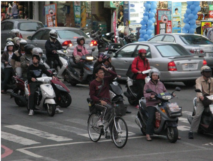
從清大夜市出來的車輛，首先看到的就光復路。