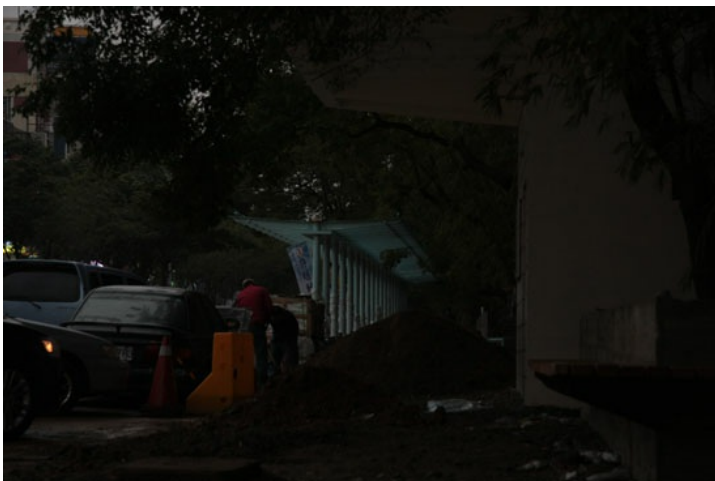
正在整修的原客運站。