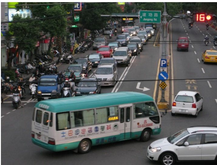
下午四、五點是車潮開始湧現的時候。