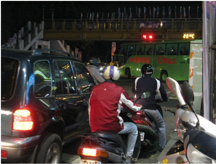
到底是汽車欺負機車還是機車阻礙了汽車，有時候真得分不清。