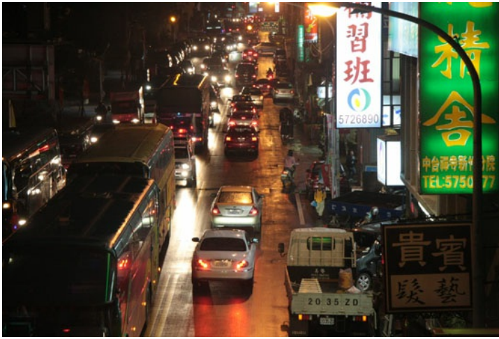
連接光復路的次要道路也因光復路的擁擠而回堵。