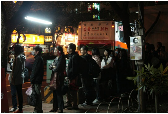
大排長龍歸心似箭的學生們在臨時客運站等待。