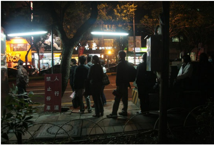
好不容易可以搭到車了，頭不由自主地向路的那一頭望去。