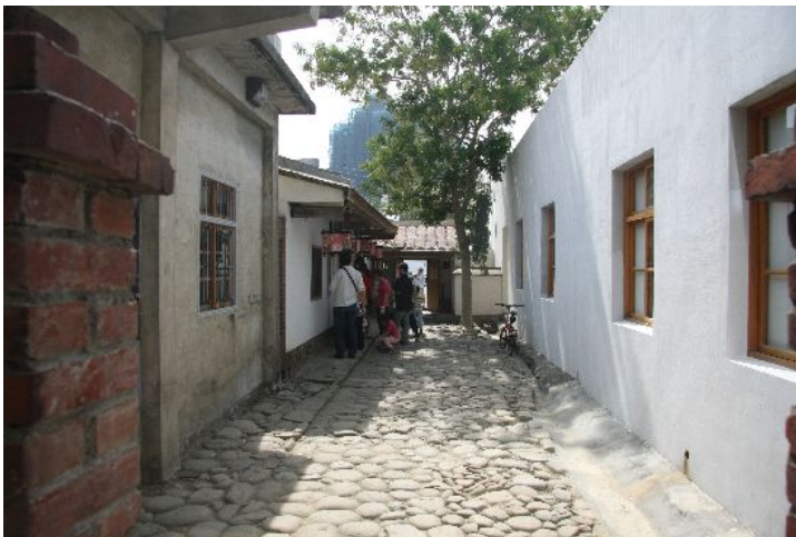
走回時光長廊，從太陽能屋走出去又是另外一種不同的光景。