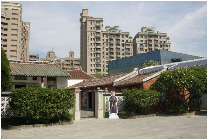
從這個角度看新瓦屋，別有一種層次的美感。