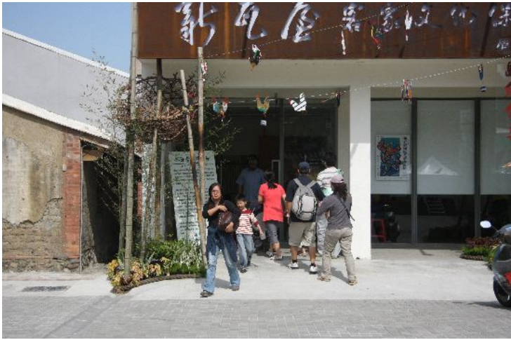
積極以嶄新的面貌，重新包裝客家文化的新瓦屋文化展覽館，人潮不斷。（攝／陳明鈺）