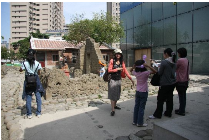
遊客們似乎只會靜靜的緬懷過去的東西，卻鮮少注意到這個衝突的角落。