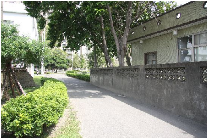
新瓦屋客家保存區，也有這樣一個角落，像極了讓人懷念的舊時巷弄。