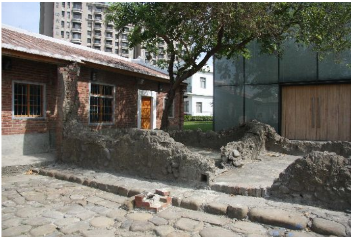
新瓦屋唯一展現時代衝突感的角落，同時具備四種不同類型的建築：從一開始來台祖建造的土屋，到磚屋、大廈住宅、以及最後的高科技太陽能屋。新瓦屋重現新舊衝突，保存這樣特殊的角落就是想引導來這裡的人看見新瓦屋的成長與歷史。

走過這裡一圈，可以看到新瓦屋的歷史文化，正在面臨時代的轉變。起初有些在地人反對接受這些外來的科技文化，如今卻也漸漸隨著時間慢慢地沉澱和接受。我們期待著新瓦屋的蛻變，卻也同時思考著傳統文化面臨商業包裝後所帶來的種種問題。