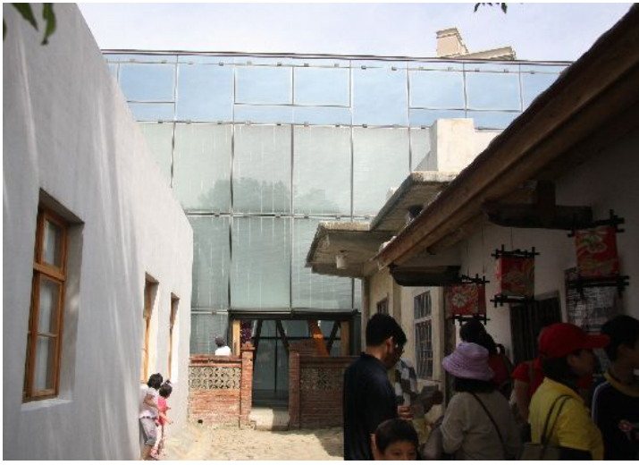
這條象徵時代變遷的小路，從過去走到現在，從老舊走向高科技。太陽能屋的建造，讓新瓦屋多了一點時代尖端感，卻也同時增加了現代與傳統間的不協調美學。