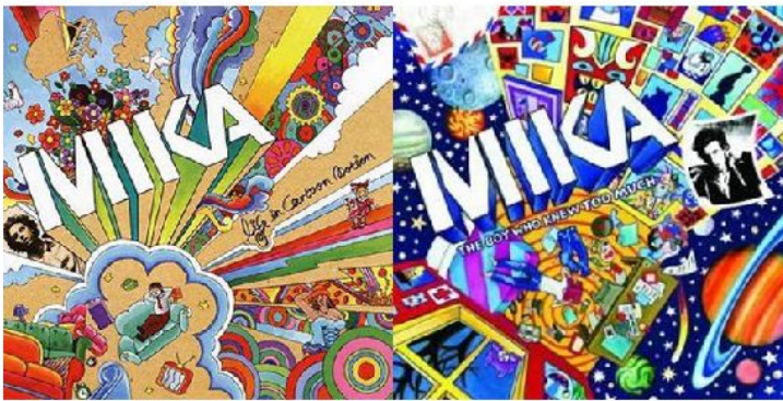
MIKA不只是流行音樂的新指標，他的獨特風格讓他也成為藝術界的新典範。

在《The Boy Who Knew Too Much》(這個男孩想太多)全新專輯當中，MIKA走出第一張以角色為基調的《卡通人生》，回到最單純的青春歲月，吟誦男女的戀愛，哼唱80年代的Disco舞曲。從〈By the Time〉(那時候)其中的歌詞「Don't wake up, won't wake up, can't wake up.」(不要清醒、不想清醒、不能清醒)，說明不想回到現實的複雜心情，當你陷入午夜十二點後的哀傷情緒，美麗的童話頓時幻化成泡沫，但日子依然會繼續下去，如果能一直在做夢，不要醒來該有多好？不過，歌曲〈Pick Up Off the Floor〉(撿回你的愛)很快就宣告覺醒時刻的來臨：「Love is lost, life can burn. But your luck will return.」(愛情會逝去，生命會毀壞，但幸運還是會回到你身旁)。MIKA的悲慘童年，反而成為創作音樂的原動力，透過無窮的想像力，用音樂散撥歡樂、散播愛，他的歌曲永遠不會令人感到消沉，活像是熱鬧又有趣的嘉年華。由於他的音樂辨識度極高，忽男忽女的古怪唱腔、戲劇性的瘋狂吟唱、故事性的寫實歌詞與輕易變換的五個八度音階，讓他遊走於各式型態的歌曲，敘述著二十一世紀金光閃閃的美好生活。